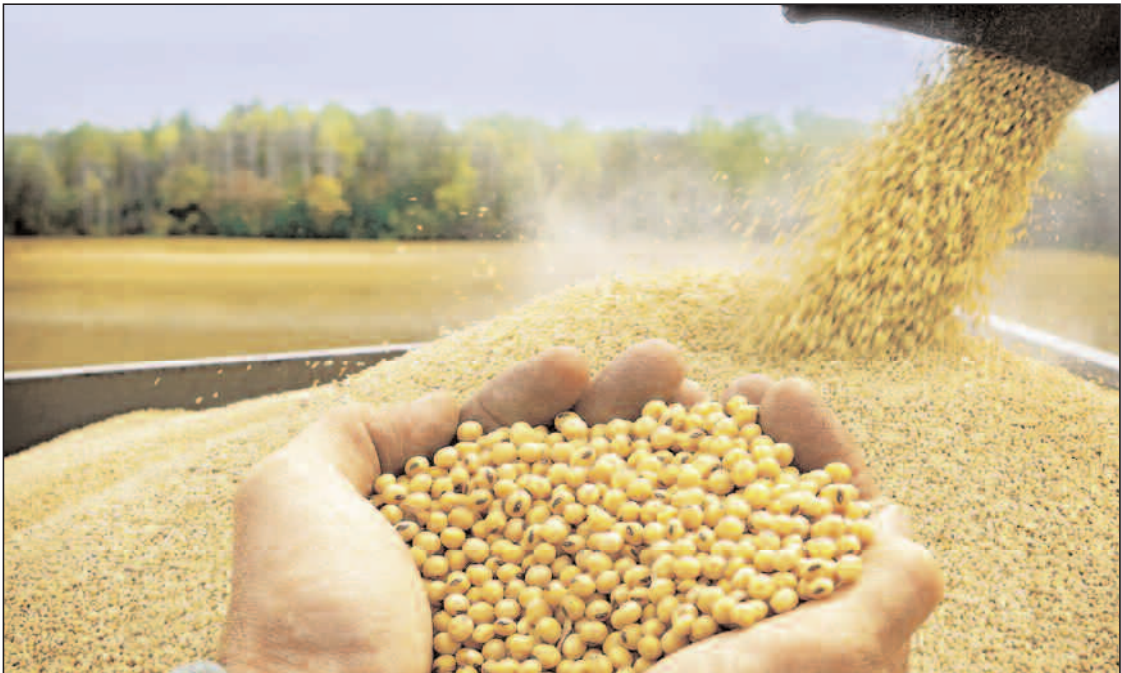
■ Le ministère de l'Agriculture a rassuré l'ensemble des professionnels, notamment les acteurs de la filière avicole, quant à la disponibilité du maïs sur le marché national en quantités suffisantes...

En effet, le ministère de l'Agriculture, du Développement rural et de la Pêche a fait savoir, dans un communiqué rendu public lundi passé, que l'Office national des aliments de bétail (ONAB), a programmé l'importation de quantités supplémentaires de maïs, estimées à 1,150 million de tonnes jusqu'au mois de février prochain, en vue de renforcer les niveaux d'approvisionnement du marché en ce produit, et de répondre à la forte demande actuellement enregistrée. Cette décision intervient après avoir identifié une carence dans la disponibilité de ce produit, à l'issue d'une rencontre ayant réuni le ministre du secteur avec les représentants de la filière avicole. « L'ONAB a entamé l'importation de 1.150.000 tonnes de maïs durant la période allant du 28 décembre courant à février 2026, après avoir constaté un déficit dans l'approvisionnement du marché en ce produit, à l'issue de la rencontre ayant réuni le ministre du secteur avec les représentants de la filière avicole. Au cours de