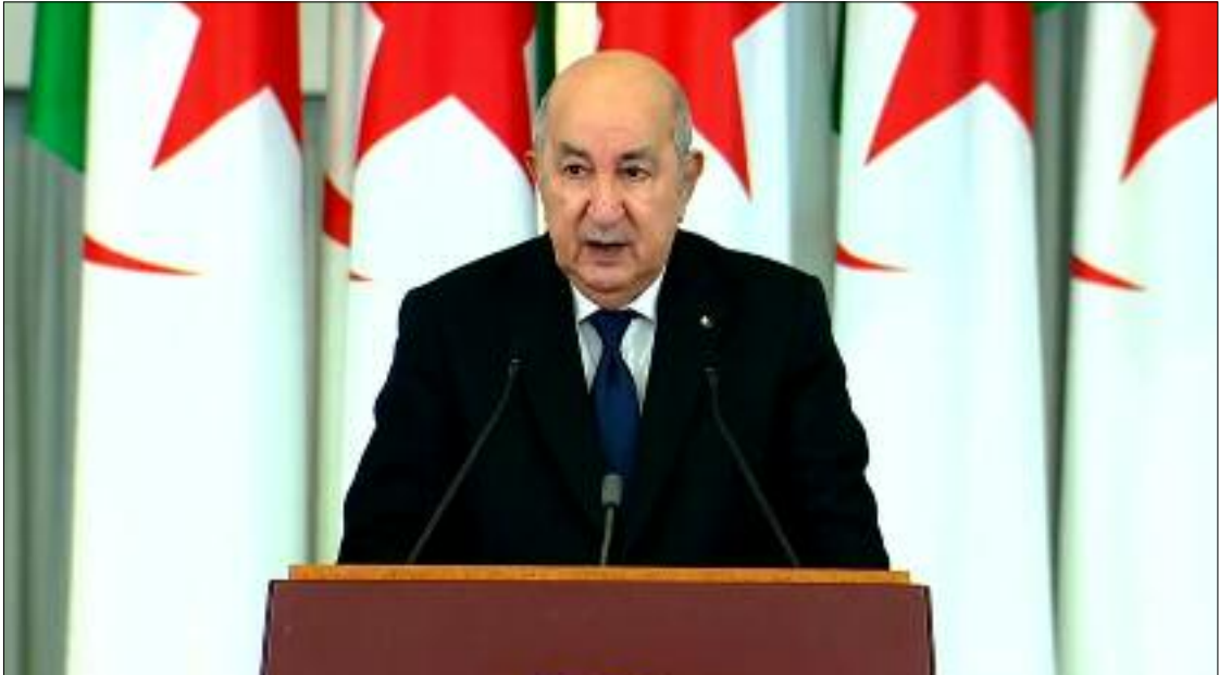
Le Président Tebboune a souligné que cette réunion institutionnelle s'inscrit dans la tradition constitutionnelle et reflète le statut du pouvoir législatif et son rôle au service du public, des citoyens et de la nation.

Cette tradition institutionnelle vise à revitaliser et à consolider la communication avec le public, en soulignant le rôle essentiel des parlementaires comme représentants de la volonté citoyenne et défenseurs de leurs préoccupations et aspirations, reflétant ainsi la place centrale de l'institution législative dans le processus politique nationale.