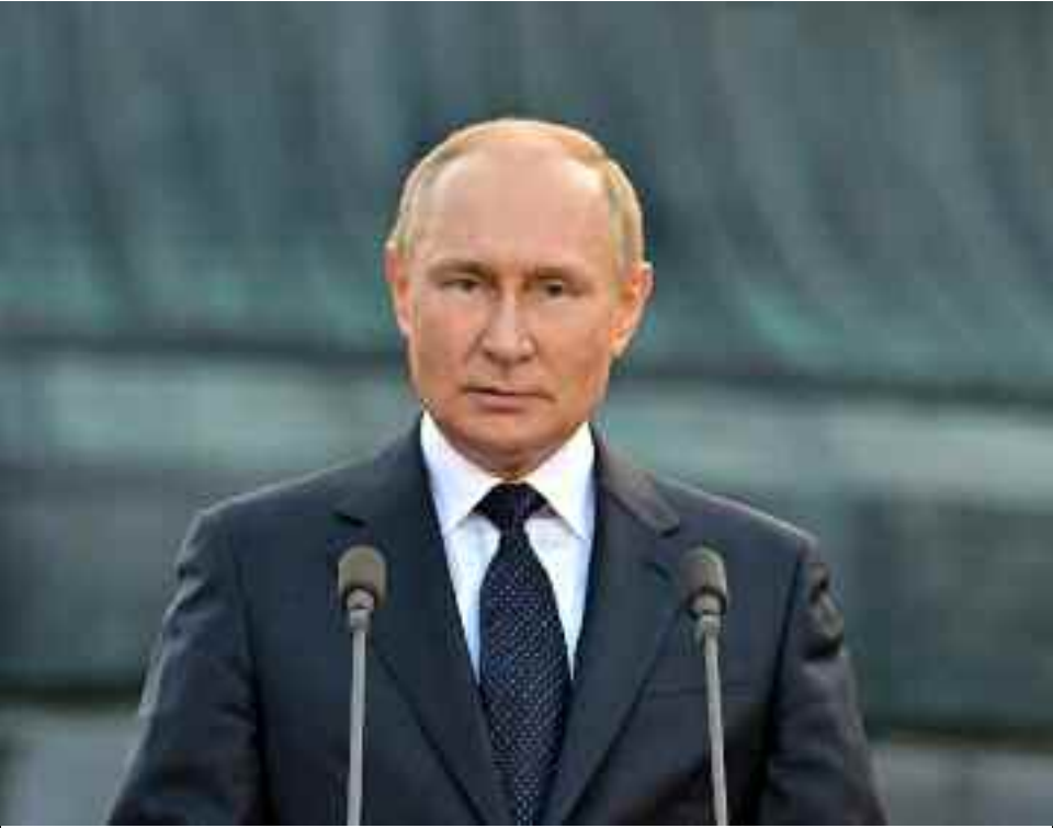
Vladimir Poutine, président de la Fédération de Russie.

Le président russe Vladimir Poutine a ordonné ce lundi aux commandants militaires de poursuivre l'an prochain les efforts visant à garantir une « zone de sécurité » le long de la frontière de son pays avec l'Ukraine. Lors d'un briefing des commandants militaires russes sur la situation sur la ligne de front en Ukraine, Vladimir Poutine a écouté des rapports sur différents secteurs du front du conflit, qui entre prochainement dans sa cinquième année. Au cours de cet échange, levgueni Nikiforov, chef du groupement de forces «Nord », a affirmé que la «zone de sécurité » de la Russie dans la région ukrainienne de Soumy, au nord-est du pays, s'étendait sur plus de 16 kilomètres de profondeur. Affirmant que les unités russes en première ligne se trouvaient à moins de 20 kilomètres du centre administratif régional, la ville de Soumy, Nikiforov a également indiqué que