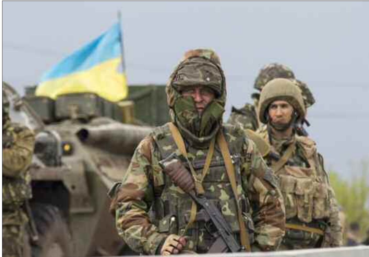
La question du nombre du contingent de l'armée ukrainienne de la période post-guerre est présentée comme un des points clés du désaccord entre les Russes et les Ukrainiens.

Il est pertinent de rappeler qu'avant l'entrée de la Russie en guerre, l'ensemble des forces armées ukrainiennes comptait environ 200 mille soldats et officiers. Ce chiffre tenait déjà compte de la guerre menée par Kiev dans la région du Donbass depuis avril 2014. Parallèlement, les armées les plus importantes des pays de l'Union Européenne en