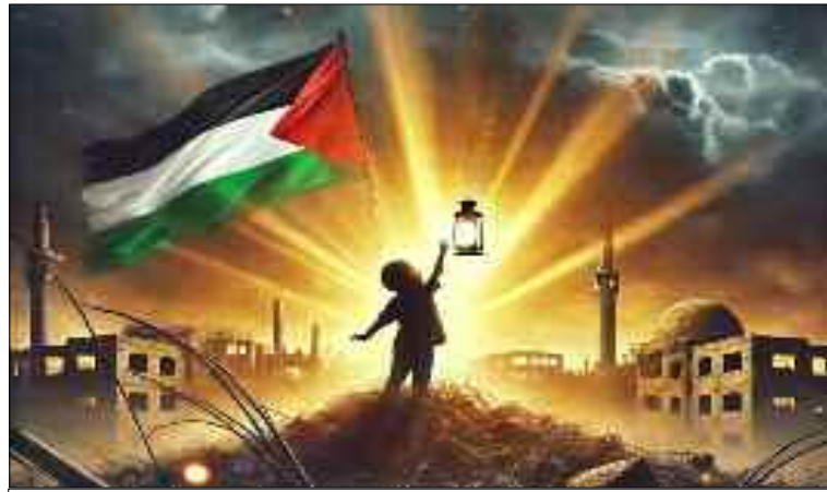
■ Ghaza écrit une nouvelle épopée faite de patience, de foi et de victoire.

Quand on parle de Gaza, on parle d'une école complète de résilience et de défi. À chaque agression, les bombes tombent sur les maisons, les écoles sont détruites, les hôpitaux bombardés. Pourtant, les sourires des enfants au milieu des ruines, les paroles des femmes soutenant leurs hommes, et les chants de liberté qui jaillissent des cœurs des assiégés forment un tableau de victoire qui ne se mesure ni au nombre des martyrs ni à l'ampleur des destructions, mais à l'esprit de dignité invincible. Gaza ne combat pas seulement avec des armes, mais avec une conviction inébranlable que le droit triomphera, peu importe combien la nuit est longue. Leur véritable arme n'est pas uniquement les roquettes, mais aussi leurs enfants qui chantent des hymnes de liberté, leurs femmes qui disent adieu à leurs fils avec des paroles de défi et de fermeté, et leurs hommes qui se tiennent sur les fronts en croyant fermement que Dieu est avec eux.