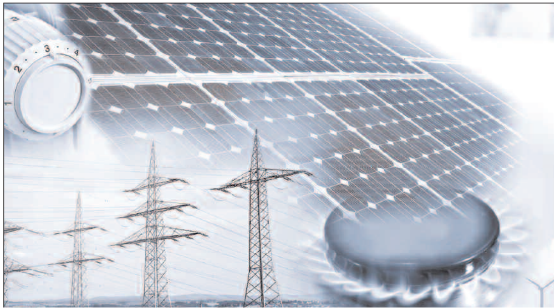
Le gaz a couvert environ 40% de l'augmentation de la demande énergétique mondiale, une part supérieure à tout autre combustible.

Selon les premières estimations, a ajouté la même source, le gaz a couvert environ 40% de l'augmentation de la demande énergétique