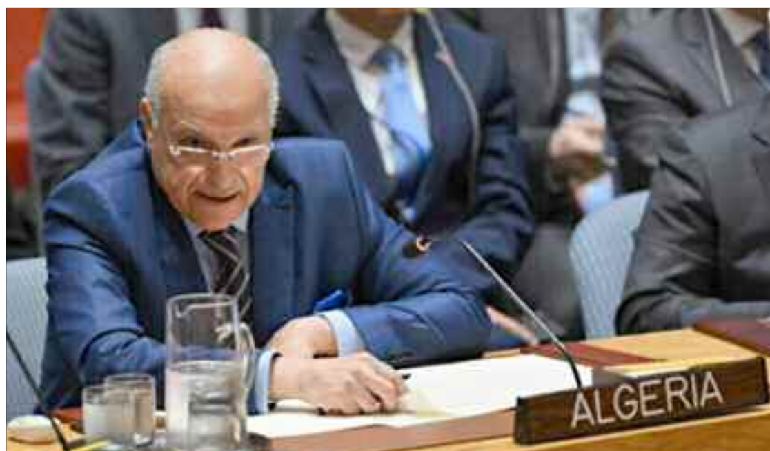
En mars 2020, le Conseil a adopté une déclaration présidentielle sur la menace posée par le terrorisme en Afrique.

Evènement phare de la Présidence algérienne pour le mois de janvier, la réunion ministérielle du Conseil de sécurité de l'ONU sur «la lutte contre le terrorisme en Afrique» a été présidée, hier, à New York, par le ministre d'Etat, ministre des Affaires étrangères, de la Communauté nationale à l'étranger et des Affaires africaines, Ahmed Attaf, chargé par le Président Abdelmadjid Tebboune.