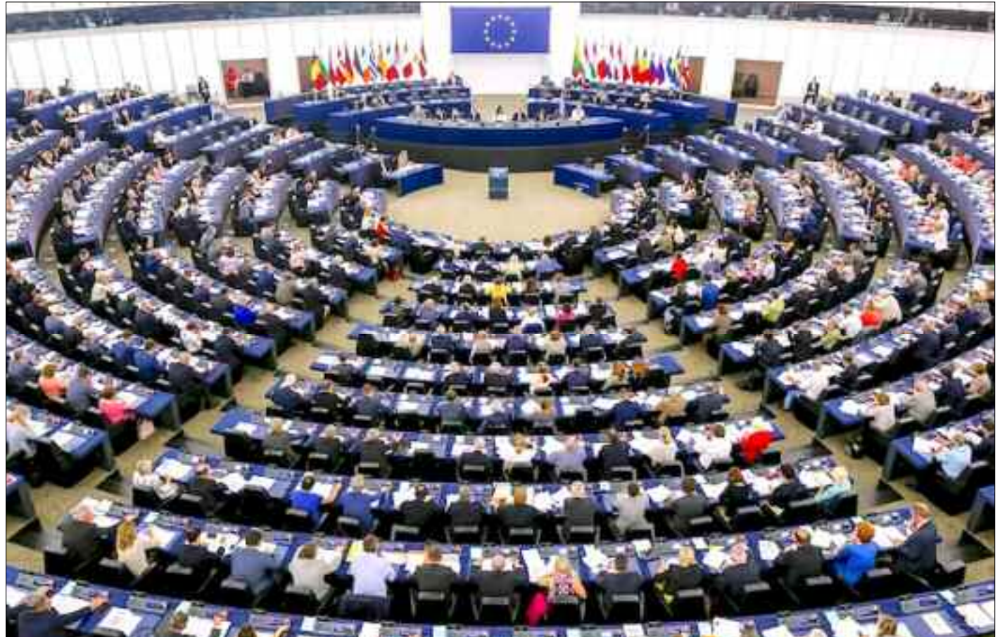
■ Marie Arena : « J'ai enfin été entendue », a déclaré ce week-end la blanche colombe triomphante. « Je ne suis pas inculpée pour corruption. Je ne suis pas inculpée pour blanchiment. Je suis uniquement inculpée parce que je serais membre d'une organisation criminelle ».