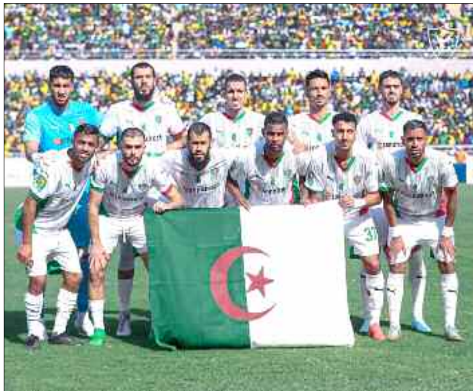
■ Le MCA, seul représentant algérien en Ligue des champions.

Al Ahly, le mastodonte égyptien, reste et compte rester le gardien de ses réalisations, détenteur du record de sacres (11) et double champion en titre, il a une nouvelle fois assumé son statut en Ligue des Champions de la CAF. La résonance de ses victoires construites par des joueurs de qualités et de la marque cairotes, sont les architectes