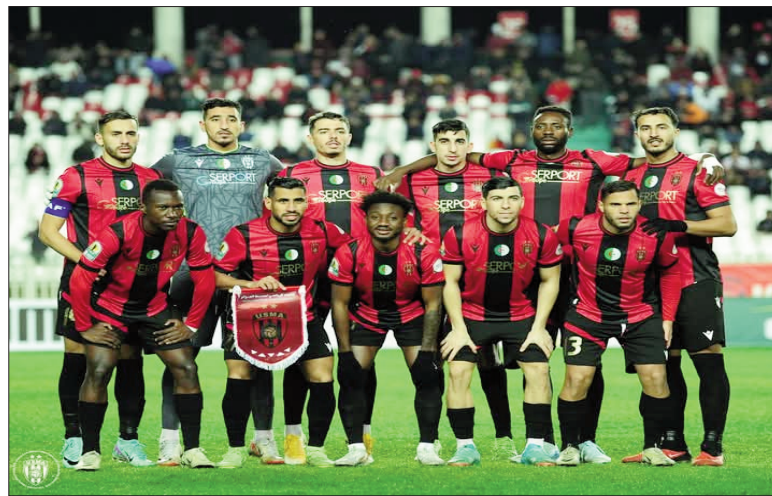
■ L'Algérie a deux représentants en C3, l'USMA et le CSC.

Les quarts de finale de la Coupe de la Confédération de football, dont les deux manches se joueront respectivement les 30 mars et 6 avril, «promettent des affrontements palpitants, avec pas moins de trois clubs ayant déjà inscrit leur nom au palmarès de cette compétition», a indiqué la Confédération africaine.