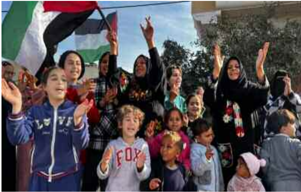
La résistance palestinienne est sortie victorieuse contre les forces d'occupation sionistes.

Le seul objectif du criminel Netanyahu n'était que tuer les civils palestiniens et rester au pouvoir pour échapper à la justice qui l'accuse de corruption. Jusqu'à hier, 47.035 personnes sont tombées en martyrs et 111.091