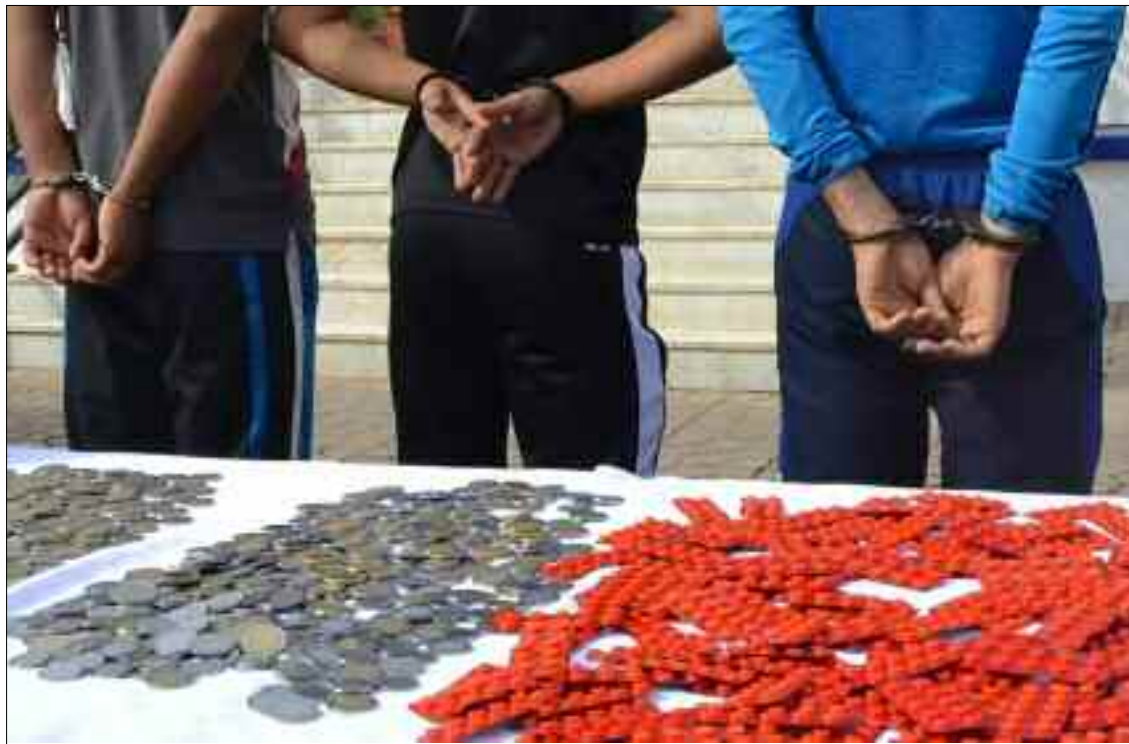
■ Démantèlement d'un réseau criminel de trafic de psychotropes, saisie de 24.000 comprimés de Prégabaline et arrestation de dix individus par les services de la Sûreté de wilaya de Tébessa.

L'opération a été déclenchée après l'exploitation de renseignements signalant le transport de psychotropes à bord d'un véhicule utilitaire de marque Peugeot. Une fois le camion repéré, les forces de l'ordre ont procédé à l'interpellation de son conducteur, qui a été conduit au poste de police pour un interrogatoire approfondi. Une fouille minutieuse du véhicule a permis de découvrir 23 612 comprimés soigneusement dissimulés dans plusieurs com-