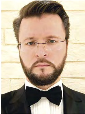
Par Oleg Nesterenko (*)

Les Jeux Olympiques de Paris ont débuté, ce 26 juillet 2024, pour le plus grand bonheur des amateurs du sport de tous horizons qui préfèrent, à juste titre et pour ne pas gâcher l'ambiance de fête, fermer les yeux sur les scandales et le chaos, sans précédent, accompagnant la période de préparation de l'ouverture des actuels jeux et de les ignorer en se concentrant sur les compétitions sportives qui se tiendront dans la capitale française jusqu'au dimanche du 11 août 2024.