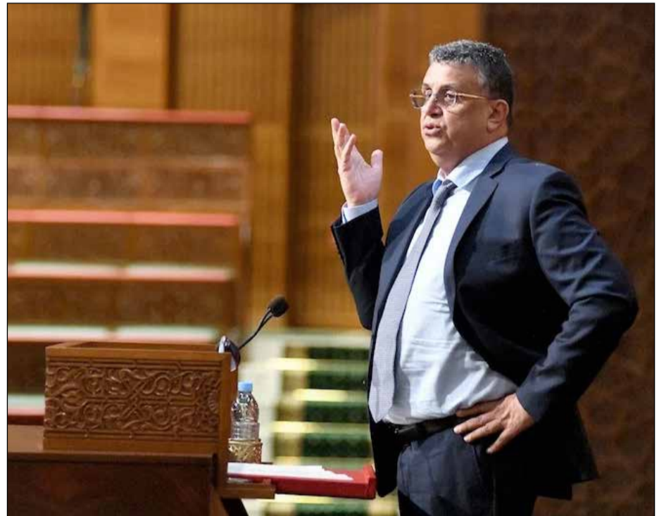
Le leader du PAM Abdellatif Ouahbi.

Mais Aziz Akhannouch n'est pas du genre à se laisser faire lorsqu'il s'agit de faire pièce aux manœuvres politiciennes qui plus est incongrues y compris de ses alliés. Incongrues car le département de l'Habitat, de