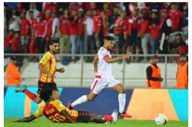
Le Wac a bien géré le match...

L e mercredi 1er novembre, l'ES Tunis accueillait le Wydad pour la demi-finale retour de la Ligue africaine. Vainqueurs à l'aller (1-0), les Wydadis, battus dans le temps réglementaire (0-1), ont dû aller jusqu'à la séance de tirs au but pour décrocher leur place en finale de la compétition (5-4, tab). Les Tunisiens peuvent nourrir quelques regrets, notamment après avoir raté une belle occasion en fin de match.