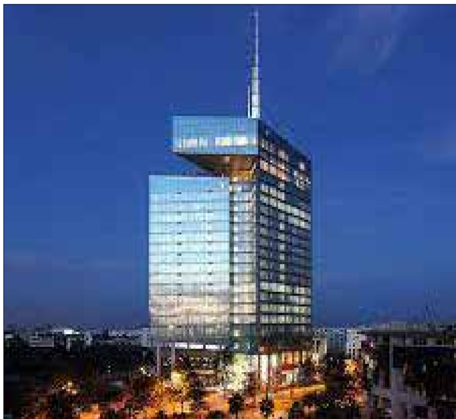
Maroc Telecom toujours au top...

M aroc Telecom est la seule entreprise du secteur des télécoms à figurer dans le Top 10 de « 500 Global » 2023, classement des « 500 plus grandes entreprises marocaines », publié par le magazine Économie & Entreprises en collaboration avec Kompas. Dans ce palmarès, le leader national des télécoms occupe la 4ème place, tous secteurs d'activités confondus. Ce positionnement distingué vient saluer les performances du groupe Maroc Telecom qui arrive bon an mal an à maintenir un excellent niveau de rentabilité et d'investissements malgré un contexte