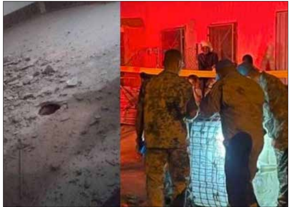
Un acte terroriste qui "ne restera pas impuni", selon Omar Hilale.

Des images ayant circulé le lendemain sur les réseaux sociaux montrent un pan effondré de la toiture d'une habitation vide et deux impacts au sol. D'autres images montrent des débris métalliques et des trous dans les murs. Pas de doute, il s'agit bien d'une attaque militaire contre des bâtiments civils ne pouvant être que le fait du Polisario. Le mouvement séparatiste à la solde de l'Algérie ne tardera pas à revendiquer ces frappes dans un communiqué, confirmant ainsi son caractère terroriste. Dans ce communiqué daté du dimanche 29 octobre et de la localité de Bir Lahlou, se vante d'avoir attaqué des positions appartenant aux « forces d'occupation » dans les localités de