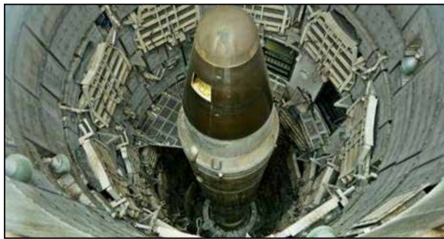
L'arme de dissuasion massive...

Toutefois, un accord étatique international n'est considéré comme valide et entre en vigueur qu'à la ratification par les pays-signataires, sans quoi il n'a pas plus de valeur juridique qu'une simple « lettre d'intentions » qui n'en a aucune. Moscou ratifie son engagement,