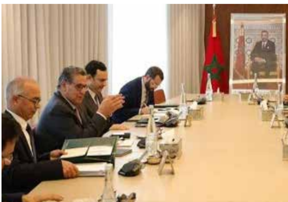
Le dossier des enseignants, un casse-tête interminable...

pation du corps enseignant et une situation matérielle en-deçà des attentes des fonctionnaires de l'Éducation nationale. Lors d'une réunion avec les centrales syndicales lundi 30 octobre, M. Akhannouch s'est engagé sur une révision du statut de la discordance dans le sens qui préserve les intérêts des enseignants conformément à l'esprit de l'accord du 14 janvier 2023 signé entre le gouvernement et les syndicats de l'enseignement et qui trace le cadre pour l'élaboration d'une feuille de route en vue d'une réforme de l'école publique qui soit centrée sur la valorisation de l'apprenant. Mais encore faut-il que ce dernier y trouve son compte en termes d'épanouissement et d'apprentissage. Une mission qui incombe principalement à l'enseignant dont les représentants doivent cesser de formuler des revendications à sens unique en recourant au chantage. Tout le défi pour le chef du gouvernement est de désamorcer une crise qui gronde, avec risque de déboucher sur des grèves dont les principales victimes sont les élèves du public. Le Maroc a connu au cours des dernières années plusieurs débrayages de professeurs mécontents du niveau de leurs revenus.