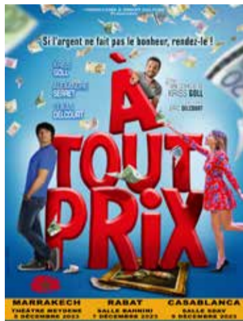
Une intrigue déjantée jouée par des comédiens justes et attachants.

Donc c'est principalement pour les jeunes, pourrait-on se dire. Pas tout à fait. Regardons de plus près d'autres avis où on peut plus ou moins percevoir la tranche d'âge des spectateurs (c'est-à-dire que même les autres avis plus hauts peuvent avoir été écrits par des gens « plus tout jeunes ») : « Je