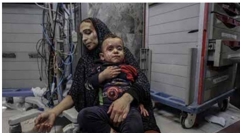
Selon le chef de l'agence de l'Onu pour les réfugiés palestiniens (Unrwa), Philippe Lazzarini, près de 70 % des victimes palestiniennes dans la bande de Gaza sont des enfants et des femmes, après plus de trois semaines de bombardements sauvages de l'enclave ravagée.

gazaouies et les destructions de bâtiments civils en faisant sien les prétextes des autorités israéliennes. A savoir que les édifices bombardés incluant des hôpitaux et des écoles servent de cachette aux miliciens du Hamas qui utilisent les habitants comme boucliers humains c'est au nom de cette même fausse justification que le camp de Jabalia a été sauvagement bombardé