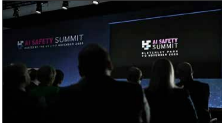
Une technologie à encadrer pour prévenir les dérives...

Pendant deux jours, dirigeants politiques, experts de l'IA et géants de la tech y sont réunis à l'initiative du Royaume-Uni, qui veut prendre la tête d'une coopération mondiale sur cette technologie. Le milliardaire américain Elon Musk, qui a cofondé l'entreprise pionnière OpenAI en 2015, a plaidé mercredi pour qu'un "arbitre indépendant" puisse "sonner l'alarme s'il a des inquiétudes" sur les évolutions de l'IA, l'une des "plus grandes menaces" qui pèsent sur l'humanité, a-t-il déclaré à la presse à Bletchley Park. Le controversé patron de X (ex-Twitter), également à la tête de Tesla et SpaceX, échangera avec le Premier ministre britannique Rishi Sunak jeudi soir. La vice-présidente américaine Kamala Harris, qui donnait un discours à l'ambassade des Etats-Unis à Londres, a elle aussi mis en garde contre les "menaces existentielles" de l'IA, qui pourraient "mettre en péril l'existence même de l'humanité", et à plus court terme, des démocraties. Kamala Harris, qui sera présente à Bletchley Park jeudi, a également annoncé la création d'un