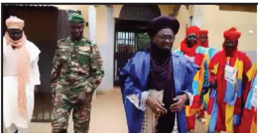
KONNI : VISITE DE PRISE DE CONTACT DU NOUVEAU PRÉFET DE KONNI CAPITAINE BOUBACAR ALI CHINA