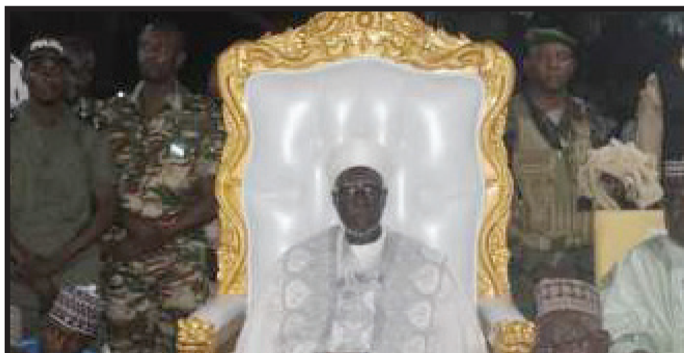
71ÈME ÉDITION DU MAOULID DE KIOTA : L'ÉVÈNEMENT LE PLUS SÉCURISÉ DE TOUTE L'HISTOIRE