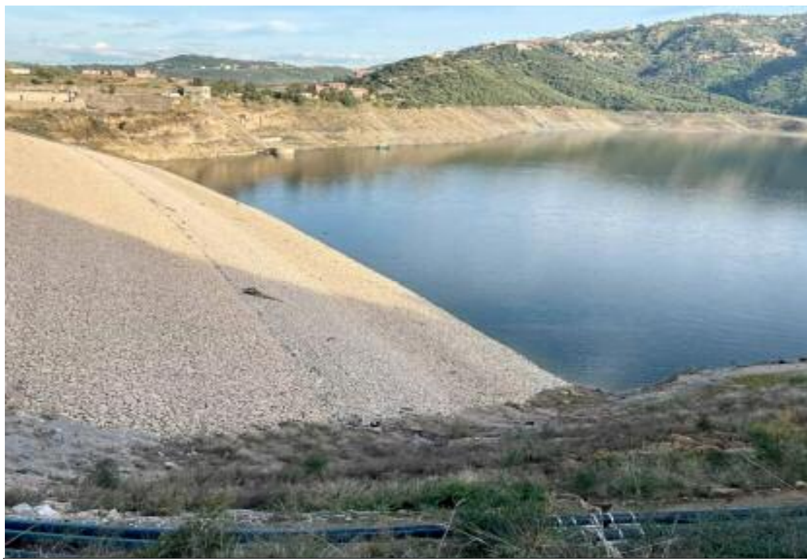
■ Face au faible taux de remplissage des barrages, les autorités publiques ont utilisé les solutions coûteuses des stations de dessalement d'eau de mer.

La station Kahrama permet à Oran de 60.000 mètres carrés / j, et 25.000 m 3 est transporté dans la zone industrielle. Dans la région ouest, Oran a reçu 100.000 mètres carrés / j de la station de déshydratation d'eau de mer à Bénisaf, qui a également été prévu pour Aïn témouche. La station de démena-