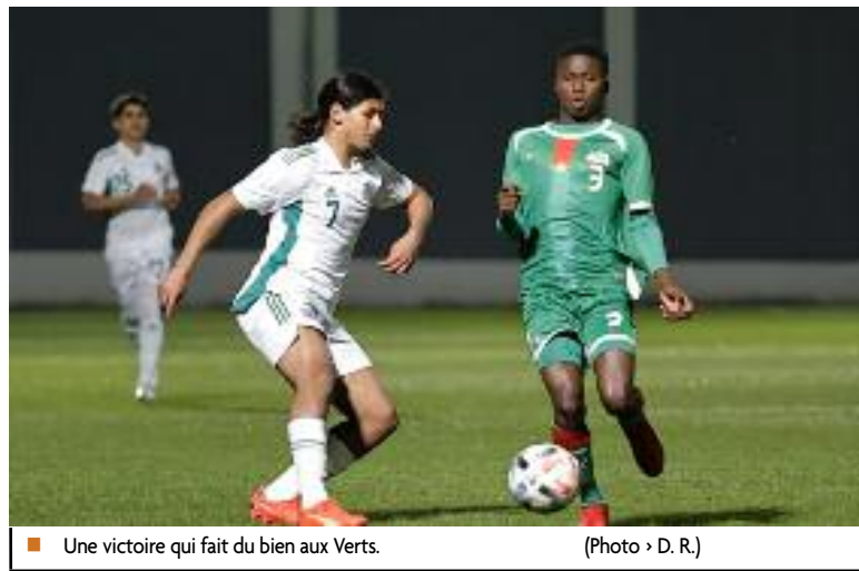
■ Une victoire qui fait du bien aux Verts.

→ La sélection nationale de football des moins de 17 ans (U17) s'est imposée face à son homologue du Burkina Faso sur le score de 1 à 0, en match de préparation disputé samedi soir au Centre technique national de Sidi Moussa (Alger), en prévision de la phase finale de la Coupe d'Afrique des nations CAN-2023 prévue en Algérie du 29 avril au 19 mai, a indiqué la Fédération algérienne (FAF) sur son site officiel.