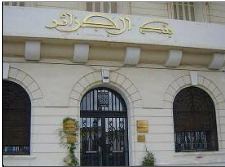
«En termes de liquidité bancaire, celle-ci ne cesse d'augmenter passant de 1.996,41 milliards de dinars à fin décembre 2022 à 2.475,817 milliards de dinars à fin mars 2023».

Cette décision a été prise, jeudi dernier, lors d'une réunion du Comité des Opérations de Politique Monétaire de la BA (COPM) présidée par le gouverneur de la BA,