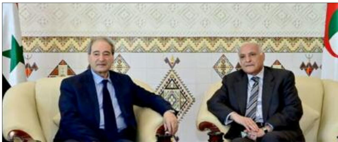
■ Fayçal Al-Meqdad : «La Syrie et l'Algérie feront front uni face à tous les défis qui se posent dans la région et le monde».

Après une période de douze ans de guerre et d'isolement diplomatique, la Syrie prépare son grand retour sur la scène arabe, notamment à la Ligue arabe, à travers la multiplication des contacts, réouvertures des représentations diplomatiques et visites officielles dans les pays arabes, notamment avec l'Algérie, compte beaucoup sur l'appui fort d'Alger, en sa qualité de président en exercice du Sommet arabe.