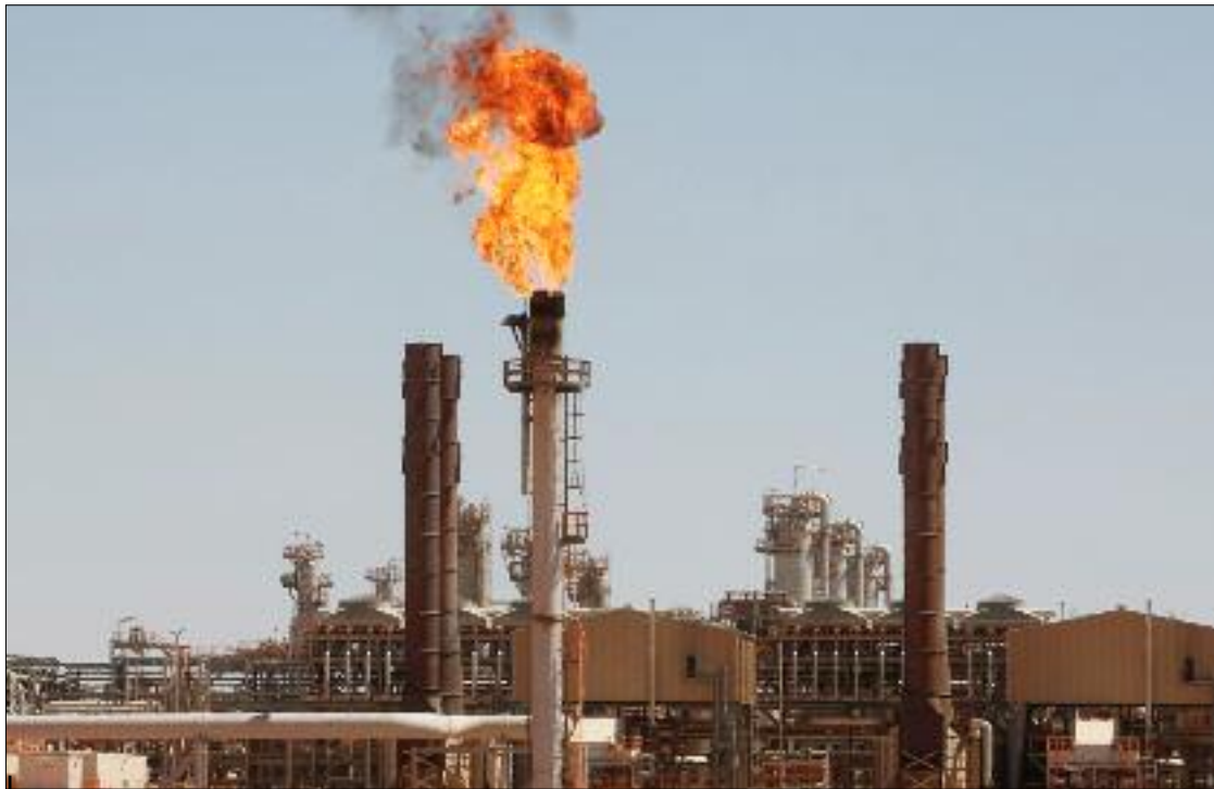
■ Pour le premier trimestre de l'année en cours, le prix moyen du Brent, baril de référence de la Mer du nord, n'a été que de 81,70 dollars contre 100,30 dollars à la même période de l'année passée. Ce qui représente une baisse de 20%.

Entraînant ainsi une perte de 15 milliards de dollars des réserves de change qui sont passées de 194 milliards de dollars à fin décembre 2013, à 178,93 milliards de dollars à fin décembre 2014. Des pertes occasionnées par une forte hausse des importations de biens qui ont avoisinées les 60 milliards de dollars.